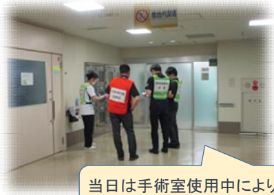
当日は手術室使用中により入口付近で火元捜索実施

【第1回目】 令和5年7月4日(火)13:30~14:10 令和5年3月13日(月)に手術室から発生した火災時における対応の課題等を検証するための訓練を実施しました。そのため、火災発生場所を捜索中に火災感知器が作動し消防署等に自動通報される想定で開始しました。また、入院患者等の他院への搬送も想定しホワイトボードへの記録も行いました。