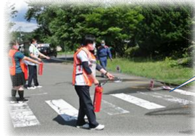
消火器操作訓練にて終了

今回は実際の火災が発生したことを踏まえての訓練ということで、役割分担が決まっておスムーズに行うことができていた。本当に火災が発生したときはどうなるかわからないため、今後とも訓練時は一生懸命取り組んでほしい。