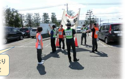
初期消火困難により本部を屋外に移設