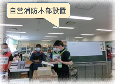
自営消防本部設置