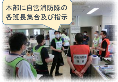
本部に自営消防隊の各班長集合及び指示