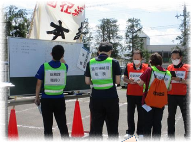
自営消防本部(隊長)に各自営消防隊班長から報告