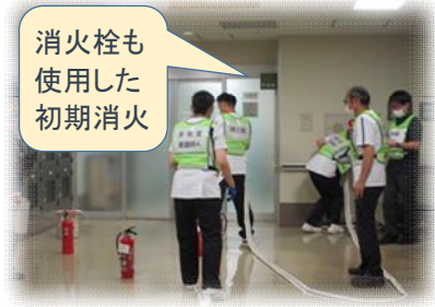
消火栓も使用した初期消火