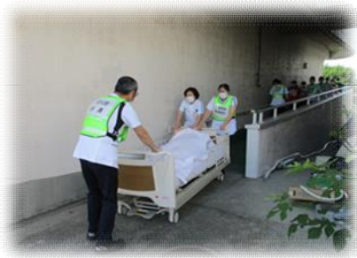
患者搬送状況 担送・護送・独歩